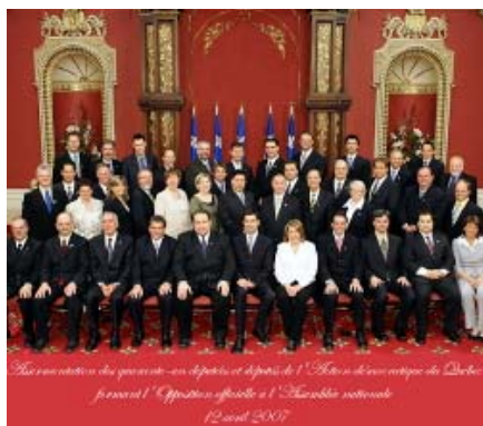
Les 41 députés de l'ADQ