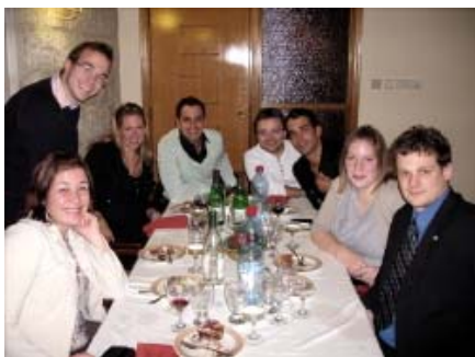
Souper de Noel à Jérusalem