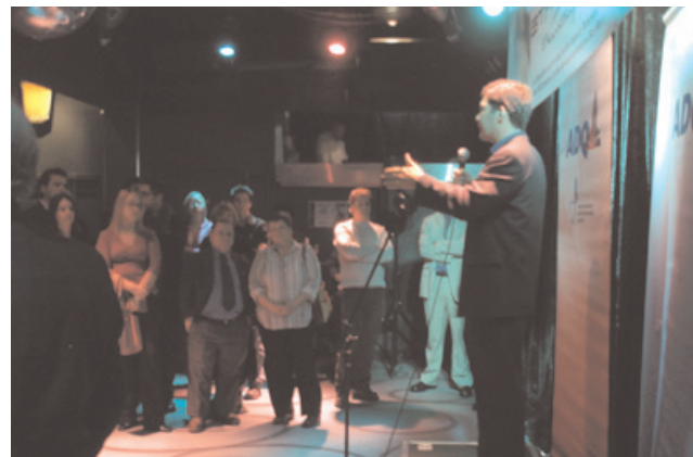
Mario Dumont s'adressant à la centaine d'adéquistes présents au dernier 5 à 7 de la Capitale nationale.

Il a conclu en répétant qu'il y a urgence pour le Québec d'avoir un gouvernement adéquistes avec une vision à long terme, et que de plus en plus la conscience populaire s'éveille à ce sujet. "Le statu quo est impossible. Le phénomène du vieillissement de la population n'est qu'à ses débuts et déjà le système de santé craque de partout. Il ne faut pas que la gaffe que les libéraux font chaque semaine nous fasse oublier que chaque année, la dette et les listes d'attente en santé augmentent. Notre devoir sera de faire réaliser aux gens le vrai bilan des libéraux".