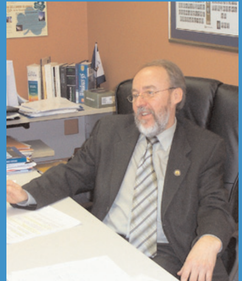
Le député de Chutes-de-la-Chaudière, Marc Picard.

«Les personnes choisies par le premier ministre doivent l'être pour leurs compétences et non pour leur affiliation politique. Les vieux partis nous ont démontré qu'en l'absence d'une loi, ils sont incapables de gouverner pour le bénéfice des Québécoises et des Québécois. Devant ce constat, nous avons pris le leadership qu'il fallait afin de permettre aux citoyens d'avoir confiance dans le processus de nomination