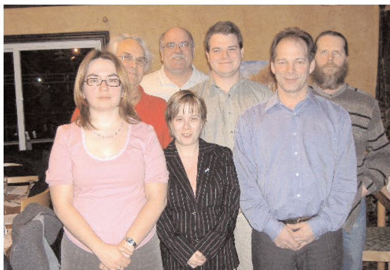
Voici les membres de l'exécutif de l'ADQ du comté de Johnson.