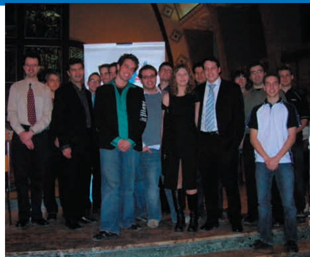
Des jeunes adéquistes en compagnie de Mario Dumont lors de l'entracte du concert de la Commission des jeunes

Le 22 mars dernier se tenait le concert annuel de la CDJ, devenu aujourd'hui une tradition. Les spectateurs ont été particulièrement choyés cette année car non seulement le trio de violonistes était extraordinaire, mais Mario Dumont et la