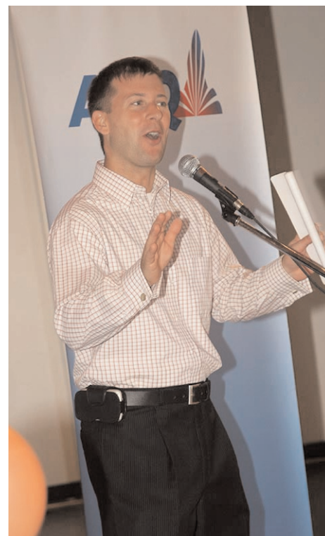
Le député de Vanier, Sylvain Légaré, s'adressant aux personnes présentes.

Pour sa part, Sylvain Légaré a mentionné tout le plaisir qu'il prend à représenter les citoyens du comté de Vanier depuis son élection en septembre 2004. «J'essaie de faire les choses différemment, d'organiser des événements originaux comme la rencon-