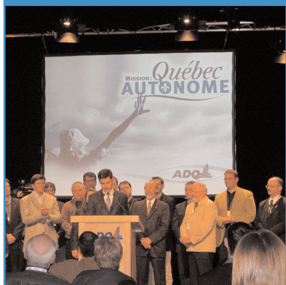
Le député de Rivière-du-Loup et chef de l'ADQ, Mario Dumont, entouré de son équipe de députés et de l'exécutif national

M. Dumont a dénoncé le cantonnement de Jean Charest dans son fédéralisme défensif. Le premier ministre du Québec n'a pas l'audace nécessaire pour saisir l'ouverture du gouvernement fédéral à l'égard d'un changement constitutionnel pire, il la nie. «Dans les faits, monsieur Charest est paralysé par la peur de l'échec, la peur de revivre les psychodrames du passé. Quant à nous, nous rejetons la peur. Ca ne fait pas partie du