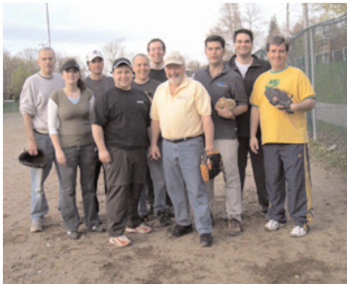
Les fiers représentants de l'ADQ.

Cette année, toutefois, la Tribune de la presse a eu le dessus et a remporté le match par 19 contre 16. Voici quelques clichés pris pendant cette agréable soirée.