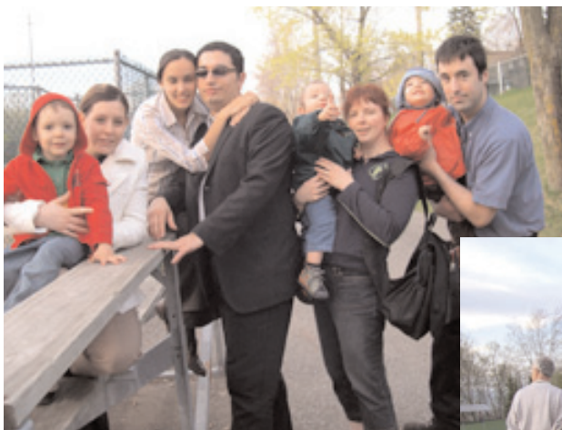
Les supporters :