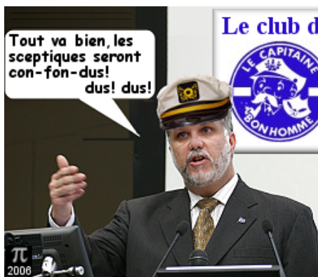
Le ministre de la Santé, Philippe Couillard