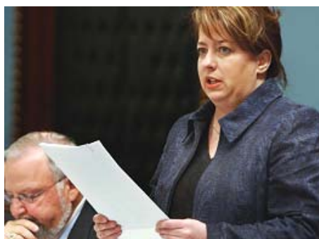
La députée de Lotbinière Sylvie Roy