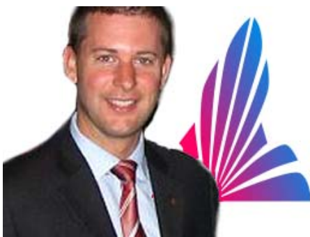
Sylvain Légaré, député de Vanier

assisté hier soir à l'assemblée d'investiture de l'actuel député de Vanier, Sylvain Légaré, qui sollicitait leur confiance pour représenter l'ADQ dans le comté aux prochaines élections.