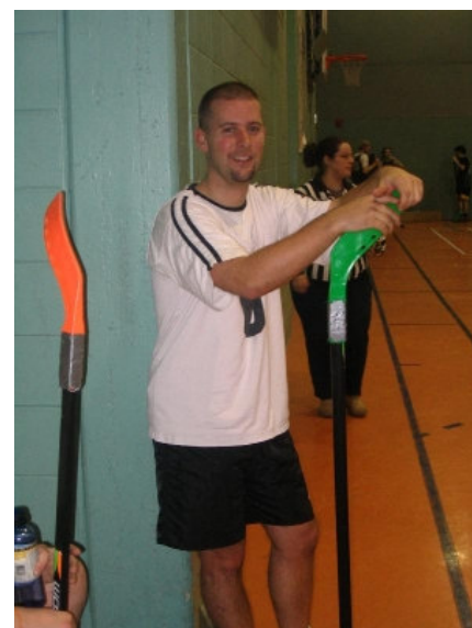
Le député de Vanier était bien satisfait du rendement de ses troupes.

gional. L'idée est d'autant plus intéressante qu'elle permet de rassembler des militants dans un contexte autre que politique, de créer des liens entre eux et entre les organisations de comté.