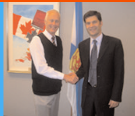
Le chef de l'ADQ, Mario Dumont a eu l'occasion de s'entretenir avec le premier ministre de la Nouvelle-Écosse, M. John Hamm.

"Je crois qu'il serait beaucoup plus approprié que le gouvernement fédéral s'active à donner de véritables moyens aux provinces pour mettre fin aux délais indignes plutôt