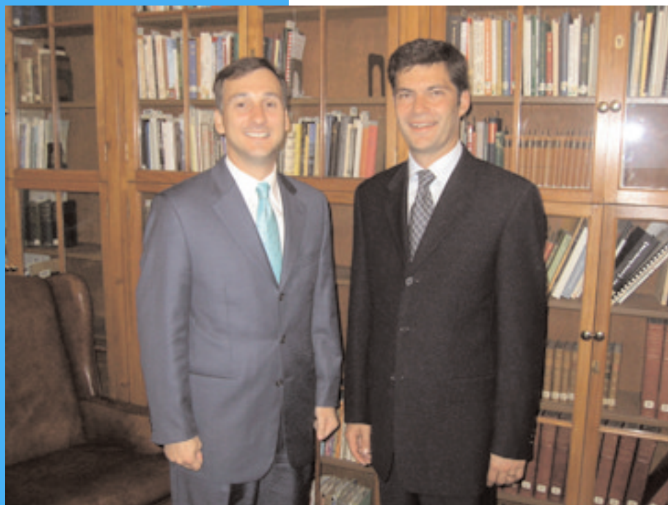
Le chef adéquiste Mario Dumont en compagnie de Bernard Lord, premier ministre du Nouveau-Brunswick.