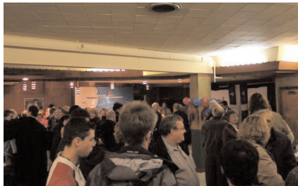
Une foule de militants adéquistes a assisté à cette inauguration.