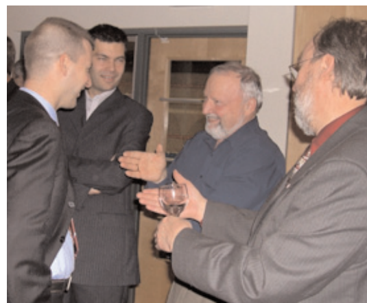
Le député de Beauce-Nord en pleine discussion avec ses collègues.