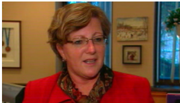
La mairesse de Sainte-Thérèse, Sylvie Surprenant

À l'hôtel de ville, la mairesse Sylvie Surprenant affirme n'avoir rien à cacher aux vérificateurs. « La ville de Ste-Thérèse a toujours eu beaucoup de rigueur, de transparence, respecté à la lettre l'ensemble des règles », a-t-elle assuré à la journaliste de Radio-Canada Anne Panasuk.