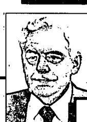
Direction générale de la vérification et de l'observance fiscale M. Robert, s.-m.a. 652-6870