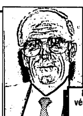
Comptabilité O. Mzoughi