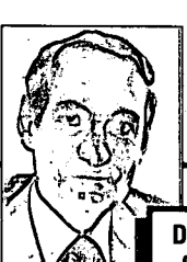
Direction générale de la perception G. Cayer, d.g. 652-6855