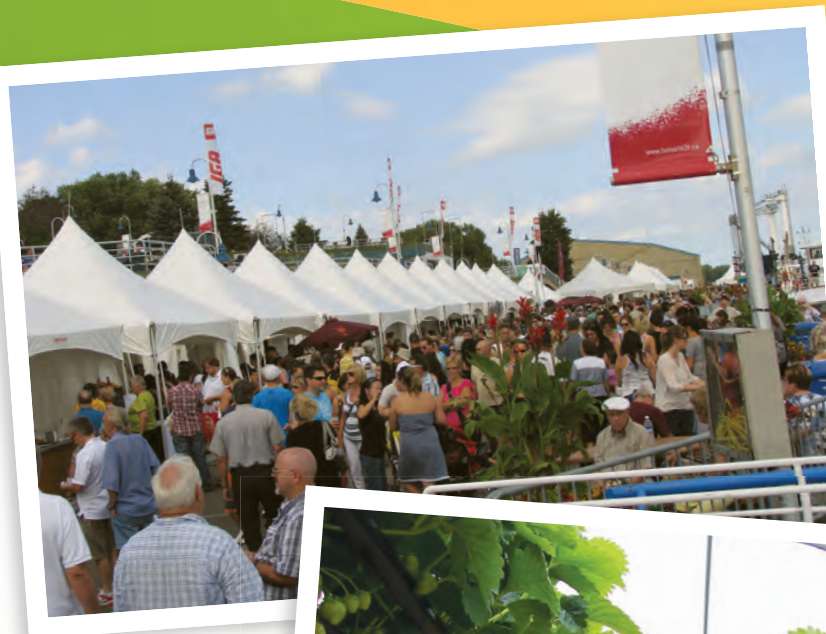
10 e anniversaire des Délices d'automne de Trois-Rivières