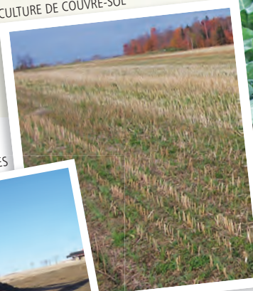
CULTURE DE COUVRE-SOL