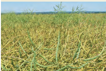
PROJET NOVATEUR DE CANOLA D'AUTOMNE