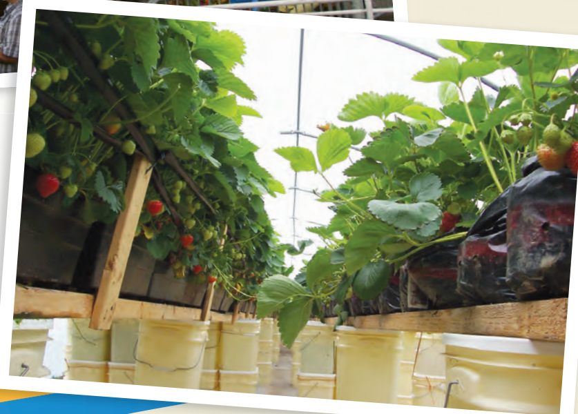
Primeur de fraises sous abris en Mauricie