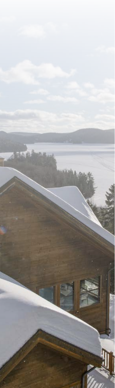
Mauricie, Hôtel Sacacomie