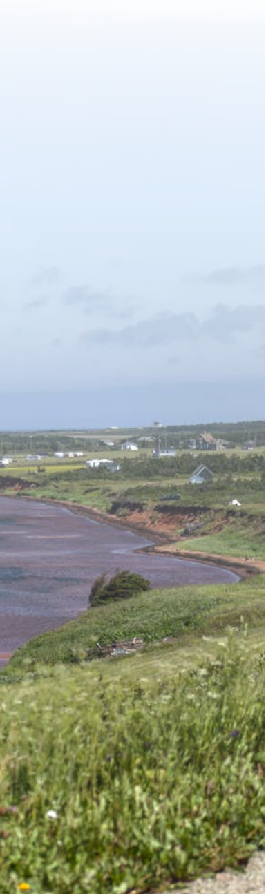
Duplessis (Côte-Nord), Île d'Anticosti