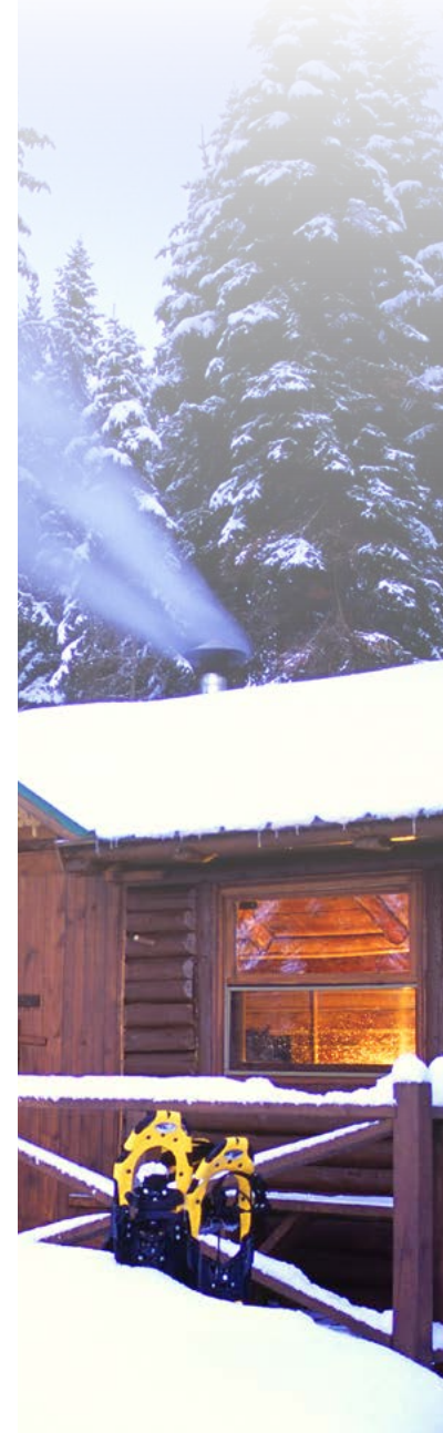
Abitibi-Témiscamingue, Parc national d'Aigüebelle