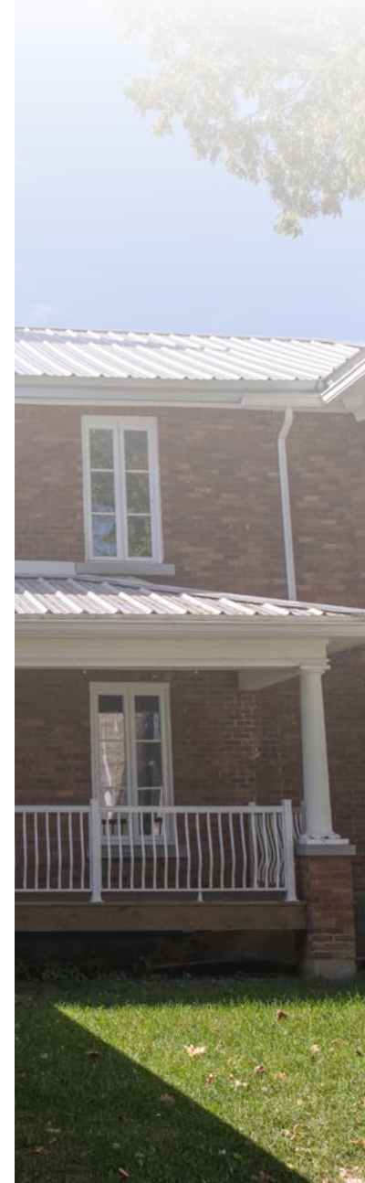
Centre-du-Québec, Musée des Abénakis