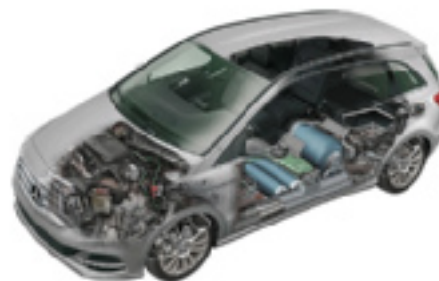
Véhicule alimenté par une pile à combustible

L'objectif du projet était d'accroître la durée de vie, la facilité de production et la densité de puissance de la pile à combustible, tout en réduisant les coûts. Le projet a été mené à bien et les efforts de commercialisation de la technologie étaient en cours au moment de notre audit.