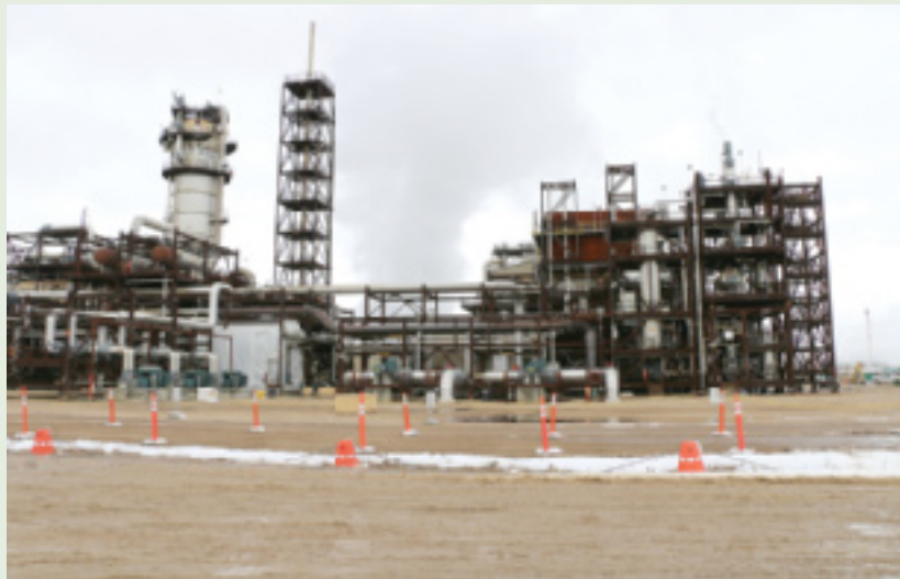
Usine de valorisation de Scotford

Entre 2012 et 2015, le Fonds pour l'énergie propre a engagé 120 millions de dollars pour appuyer le projet de Shell Canada visant à capter et à stocker le carbone à son usine de valorisation de Scotford, située à 45 km au nord-est d'Edmonton, en Alberta. Le coût total du projet pour une période d'exploitation de 10 ans devrait atteindre 1,3 milliard de dollars. L'usine convertit le bitume en pétrole brut en y ajoutant de l'hydrogène. Le système peut capter, annuellement, jusqu'à 1,2 mégatonne de CO 2 rejeté par les unités de production d'hydrogène, soit environ le tiers des émissions de CO 2 produites par l'usine. Le CO 2 est comprimé puis acheminé dans un pipeline jusqu'à un site de stockage situé à 70 km au nord-est de l'usine, puis injecté à une profondeur d'environ 2 km sous terre dans un aquifère salin.