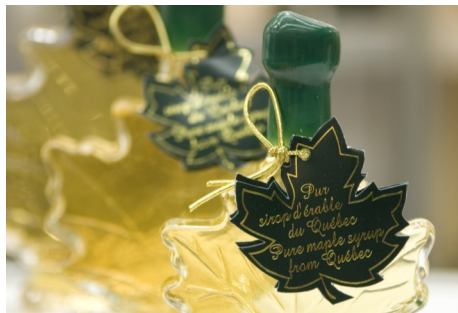
Éric Labonté, MAPAQ