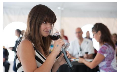
Fête des vendanges