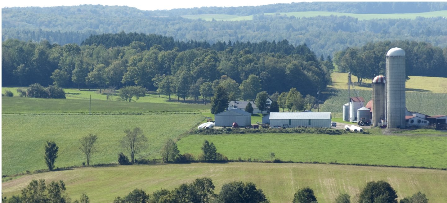
Éric Labonté, MAPAQ