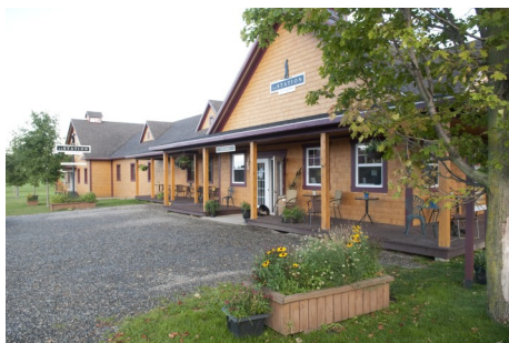
Éric Labonté, MAPAQ