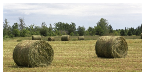
Éric Labonté, MAPAQ