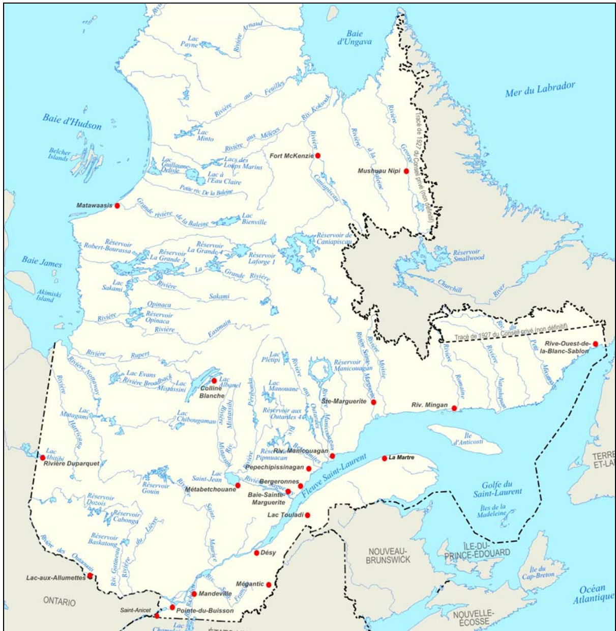
Figure 1 Localisation des sites archéologiques mentionnés dans cette étude (Fond de carte : MRNF).